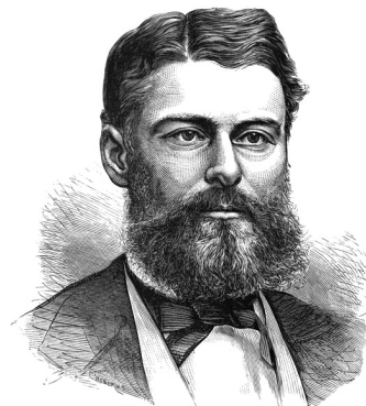
Edward Drinker Cope, gravure de 1881, publiée dans Popular Science Monthly

En plus de tout cela, Cope était un éminent défenseur du néo-lamarckisme. Pour lui, cette approche permettait de comprendre une autre caractéristique des fossiles que celle qui préoccupait Hyatt. Selon ses propres termes :