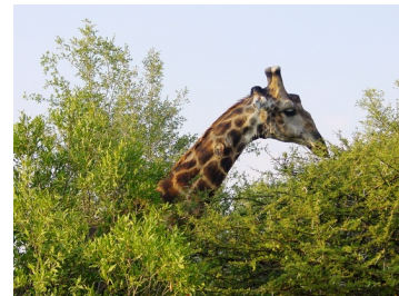
Une girafe déguste des feuilles très haut placées, Parc national Kruger, Afrique du Sud

Pourtant, il se trouve que l'évolution ne fonctionne pas comme ça (ou du moins presque jamais comme ça, nous y reviendrons) mais ce type de malentendu sur le processus évolutif est un des plus anciens et des plus répandus. Pendant plus d'un siècle, beaucoup de scientifiques de premier plan avaient la conviction que, pour décrire le problème à leur manière, les caractères acquis sont hérités , c'est-à-dire que les caractères développés par les organismes au cours de leur vie (comme un cou allongé ou de gros biceps) seront transmis à leur descendance. Darwin disait même que ce qu'il appelait « les effets de l'usage et du non-usage », c'est-à-dire la manière dont l'utilisation d'un organe ou le non-recours à un autre organe pouvaient affecter les modalités de transmission des caractères des parents à leurs descendants, étaient un facteur important dans les cas comme la disparition des yeux chez les espèces vivant dans des grottes.