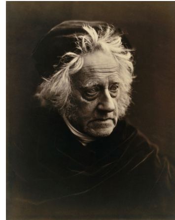
John Herschel, portrait par la célèbre photographe Julia Margaret Cameron

Changeons de perspective et penchons-nous sur la réaction générale de Herschel à la théorie de Darwin. Pour Herschel, il y a deux modes de fonctionnement possibles des changements dans le monde naturel, soit ils sont dirigés par une entité divine soit ils fonctionnent selon les lois de la nature, qui génèrent ses « causes véritables ». La sélection naturelle pourrait , à son avis, être une cause véritable. Mais pour avancer cet argument, il nous faudrait démontrer deux choses qui étaient hors de la portée de Darwin en 1859. Primo, il nous faudrait montrer que de nombreux changements survenus dans une espèce peuvent s'expliquer par la sélection naturelle. Et secundo, il nous faudrait comprendre la loi de variation, pour qu'il soit certain que la variation nécessaire à la production du nouvel organisme serait opérante au bon moment au bon endroit.