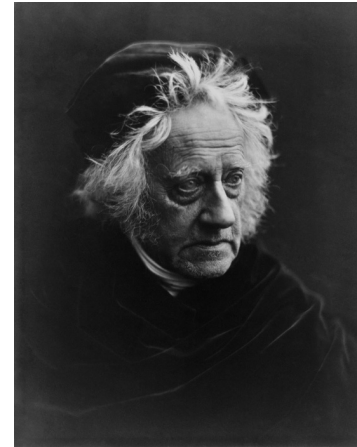
John Herschel, portrait par la célèbre photographe Julia Margaret Cameron

Changeons de perspective et penchons-nous sur la réaction générale de Herschel à la théorie de Darwin. Pour Herschel, il y a deux modes de fonctionnement possibles des changements dans le monde naturel, soit ils sont dirigés par une entité divine soit ils fonctionnent selon les lois de la nature, qui génèrent ses « causes véritables ». La sélection naturelle pourrait , à son avis, être une cause véritable. Mais pour avancer cet argument, il nous faudrait démontrer deux choses qui étaient hors de la portée de Darwin en 1859. Primo, il nous faudrait montrer que de nombreux changements survenus dans une espèce peuvent s'expliquer par la sélection naturelle. Et secundo, il nous faudrait comprendre la loi de variation, pour qu'il soit certain que la variation nécessaire à la production du nouvel organisme serait opérante au bon moment au bon endroit.