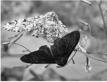
Deux phalènes du bouleau, une de la forme claire et une de la forme sombre

une explication biologique ? Quelles conséquences cela peut-il avoir sur notre vision des relations entre différents domaines scientifiques ?